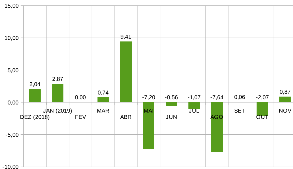
Figura 2 - Comportamento do custo da cesta básica no período compreendido entre dezembro de 2018 e novembro de 2019.