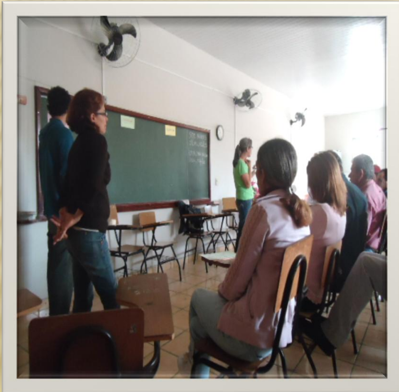
Divino/MG – 2012