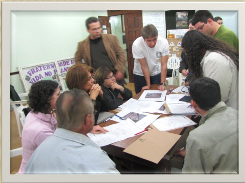
Reunião com as lideranças no Bairro de Fátima - 2011