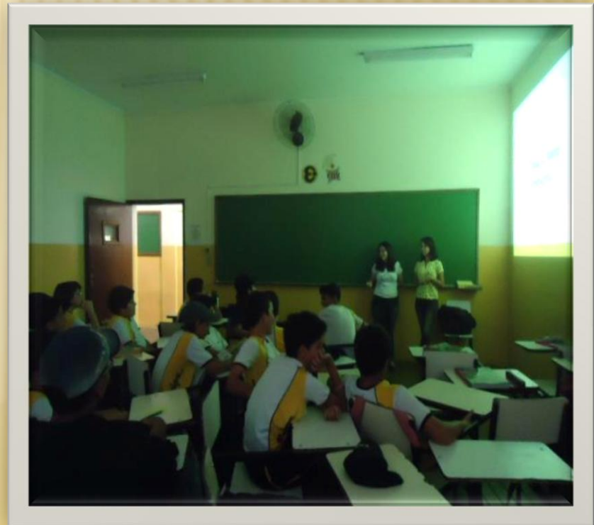
Colégio Equipe - 2012