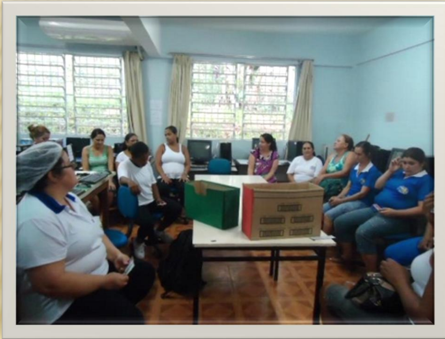
Escola Estadual Effie Rolfs – 2012