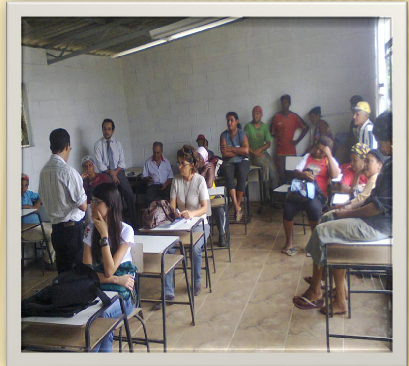
Reunião na Usina com os Associados (Bolsa Reciclagem) - 2013